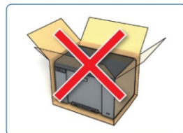
Produkt bez vnitřní výplně Riziko poškození je vysoké!