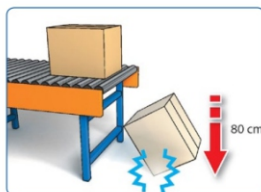
Zkouška obalu nárazem z výšky - při volném pádu do 10 kg 80 cm, nad 10 kg 60 cm (ČSN EN 22248 a 24180-20)