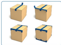
Správné zalepení zásilky Tvar dvojitého „H“